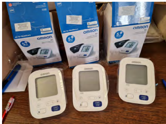
Vérnyomásmérő (3 darab)