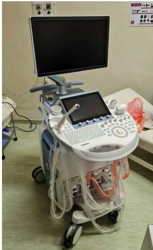
Voluson E10 BT21 LCD típusú ultrahang készülék Nőgyógyászati ultrahang Nőgyógyászati szakambulancia