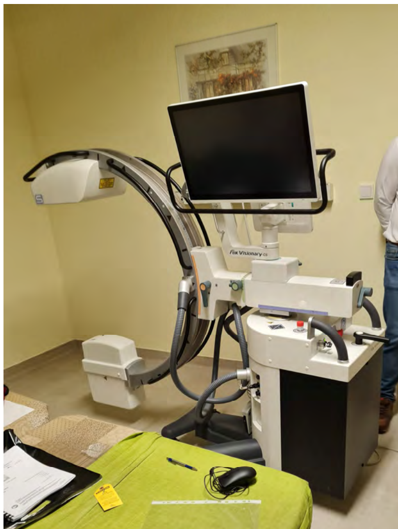
FUJIFILM FDX Visionary CS FDX Visionary CS Mobil, C-íves röntgen berendezés – közép kategóriás Pulmonológiai szakambulancia