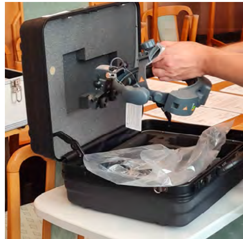
Ophthalmoszkóp (2 darab)