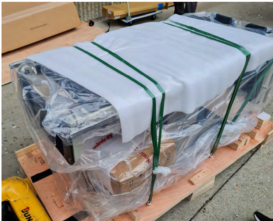
Mindray HyBase 3000 átsugározható betegasztal Pulmonológiai szakambulancia