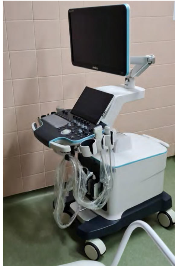
Mindray Resona R9T ultrahang készülék Radiológiai ultrahang „magas tudású” Ultrahang szakambulancia