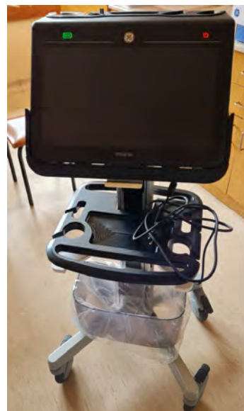
Venue Go típusú ultrahang készülék Multifunkciós, Point-Of-Care ultrahang Érsebészeti szakambulancia