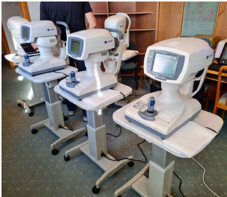
Automata kerato-, refraktométer (3 darab)