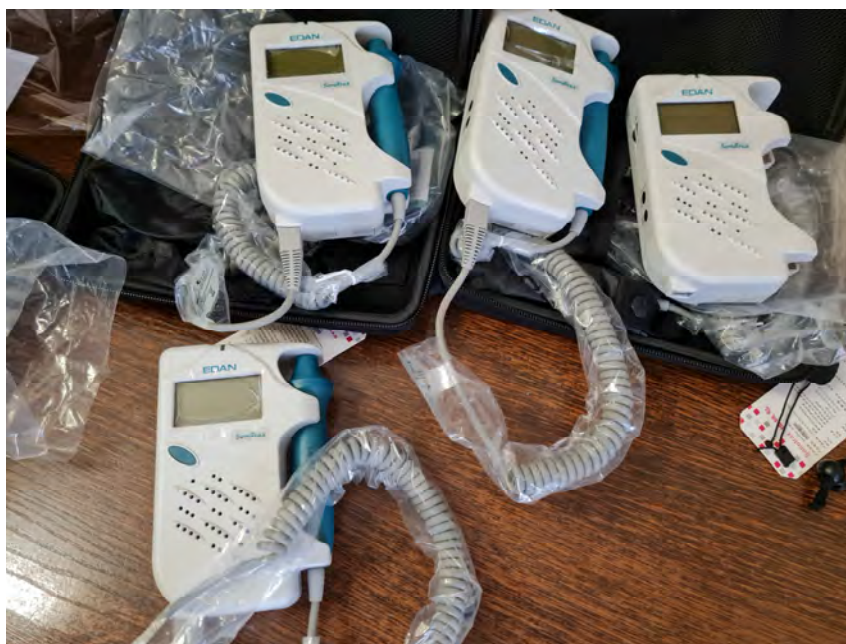
Érdoppler készülék (4 darab)