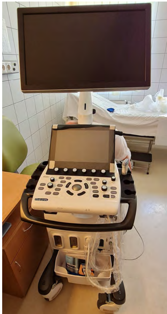
Vivid S70N - Ultra Edition típusú ultrahang készülék Kardiológiai ultrahang Kardiológiai szakambulancia