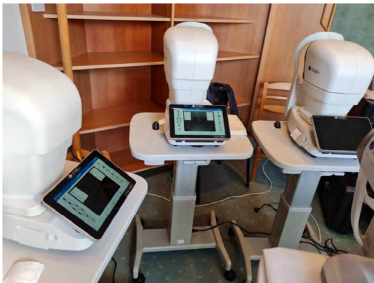
Automata non-kontakt tonométer (3 darab)