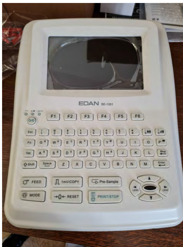
12 csatornás EKG (5 darab)