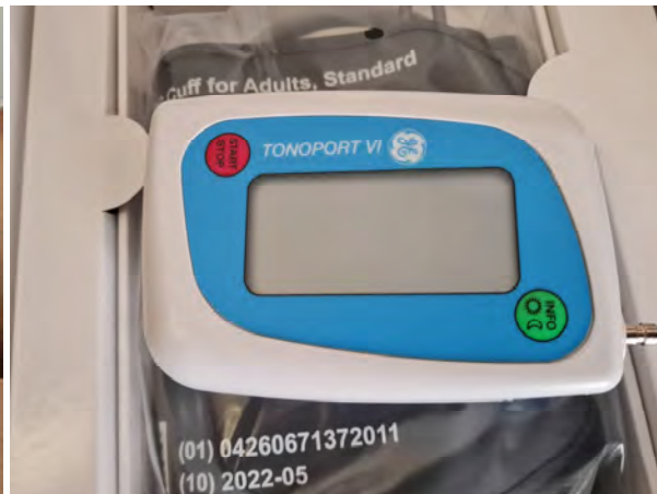
ABPM készülék (7 darab)