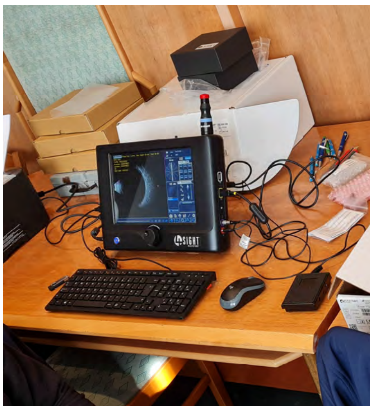
Szemészeti ultrahang (1 darab)