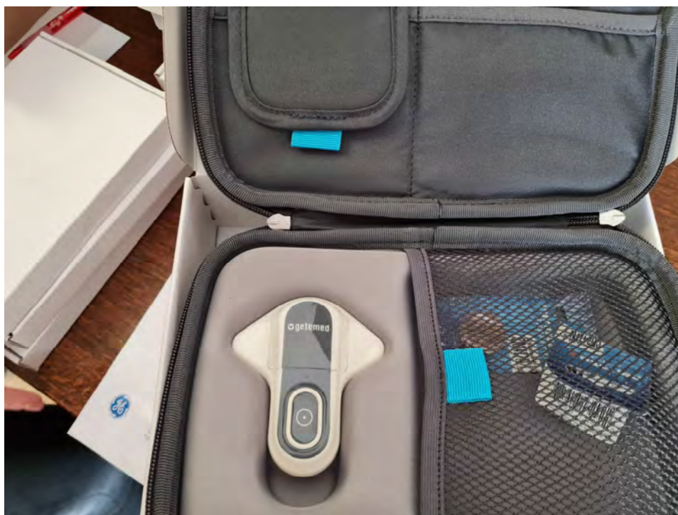
Holter EKG rendszer (1 darab)