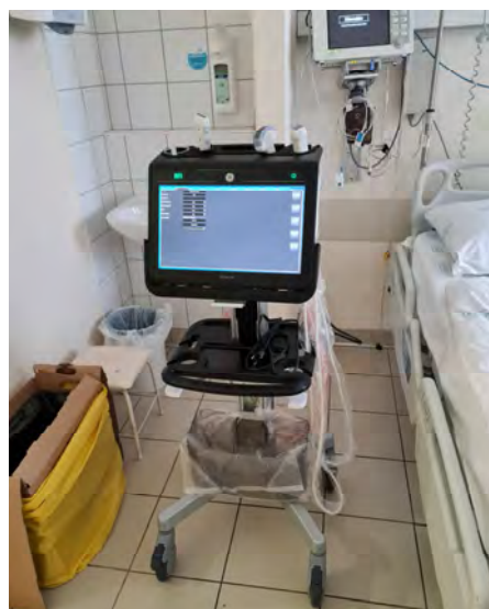
Venue Go típusú ultrahang készülék Multifunkciós, Point-Of-Care ultrahang Sürgősségi Betegellátó Osztály