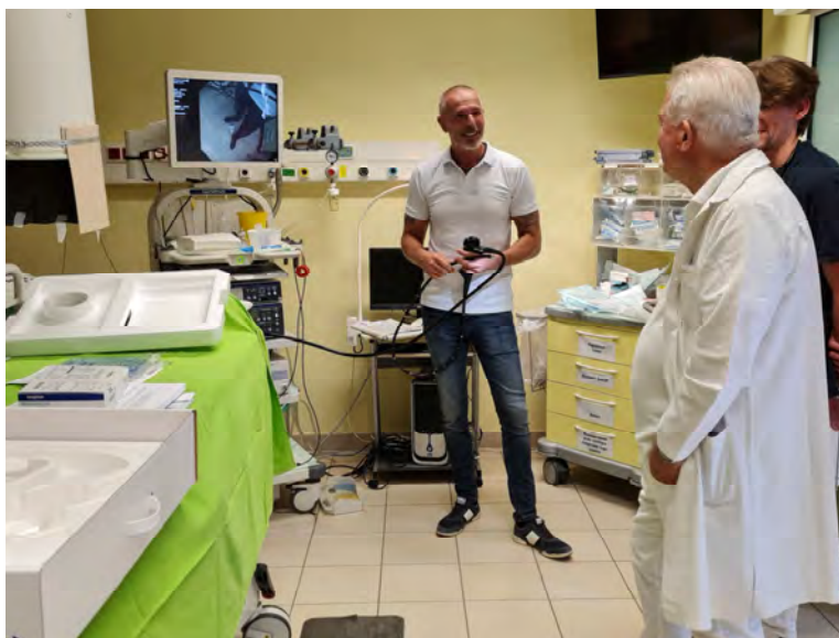
N5425051 TJJ-Q190V Videodoudenoszkóp Gastroenterológiai szakambulancia