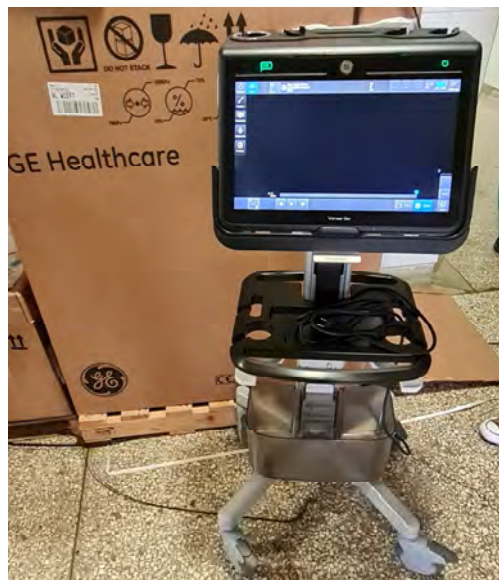
Venue Go típusú ultrahang készülék Multifunkciós, Point-Of-Care ultrahang Aneszteziológiai szakambulancia