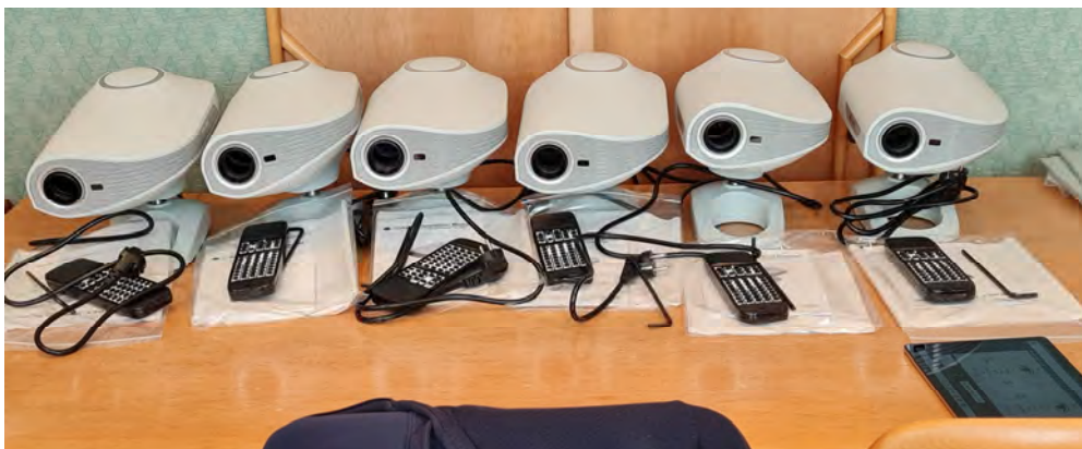
Projektoros olvasó tábla (6 darab)