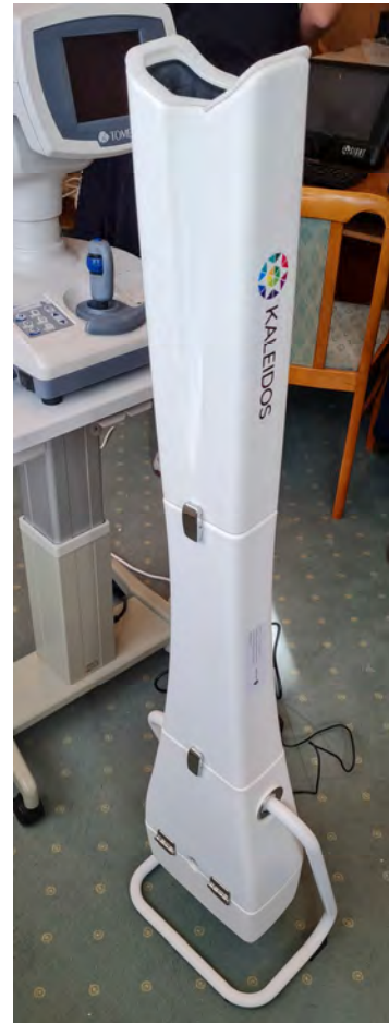
Hordozható automata refraktométer (1 darab)