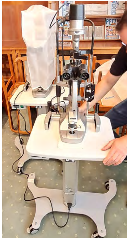
Réslámpa (2 darab)