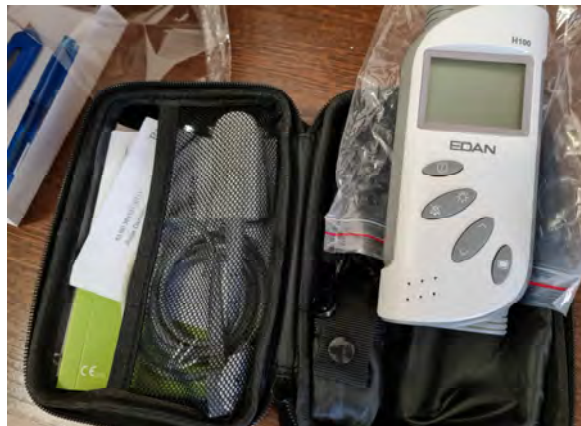
Pulzoximéter (1 darab)